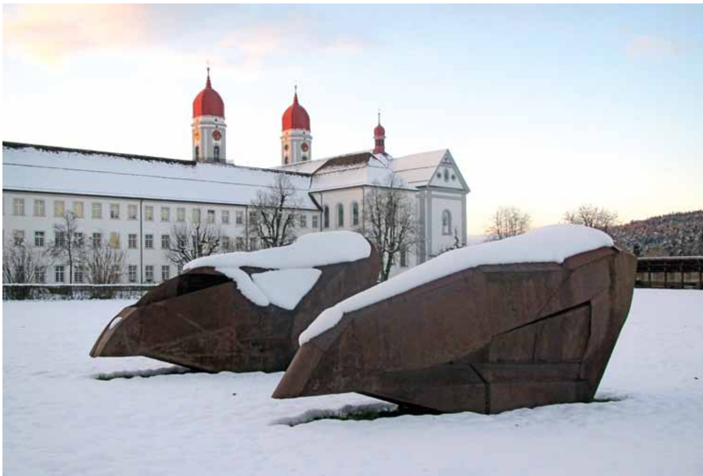
Magdalena Abakanowicz «cortene armours»