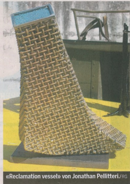
«Reclamation vessel» von Jonathan Pellitteri. FRG