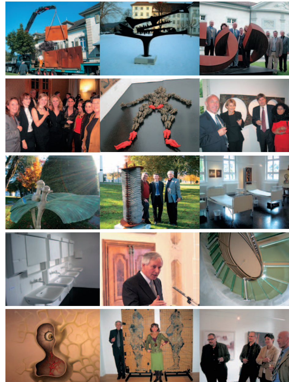
Impressionen aus dem Museumspavillon und den Künstlerkabinetten sowie der Eröffnungsfeier vom Oktober 2005

art-st-urban macht vielfältige Skulpturenkunst regionaler, nationaler und internationaler Künstler einer breiten Öffentlichkeit permanent und kostenlos zugänglich. Die prächtigen Parkanlagen und das Areal um das ehemalige Kloster St. Urban mit seinen charakteristischen Bauten bilden eine herrliche Kulisse für die Skulpturen, die periodisch ergänzt und ausgewechselt werden. Der Werkaufbau umfasst mehrere Phasen.